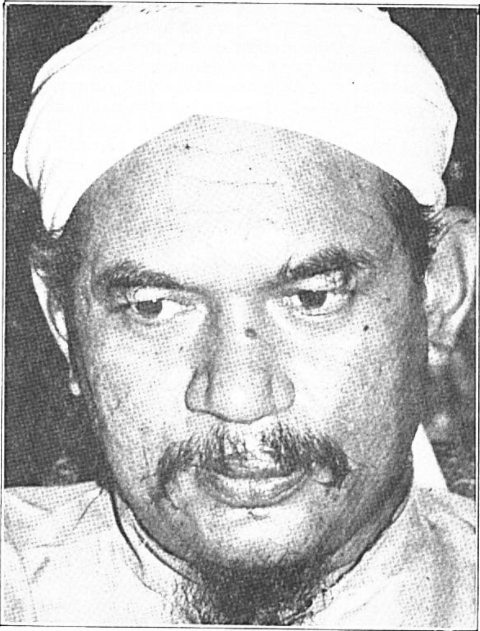
Ustaz Hadi Awang